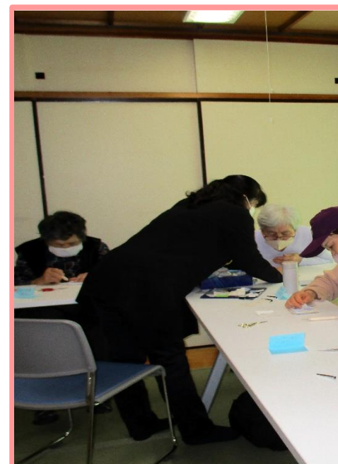
皆様に大好評！教室の様子