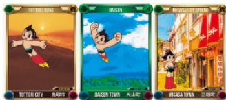
鳥取県の観光地と「鉄腕アトム」がコラボしたNFTトレカ