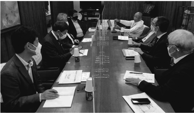
ミッション委員会の様子