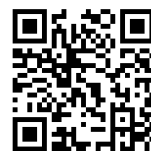
二次元コード (新宿EAST推進協議会)

新宿駅東口 まちづくり で検索または、二次元コードの読み込みによりご覧ください。