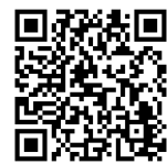
二次元コード (新宿駅東口地区のまちづくり)