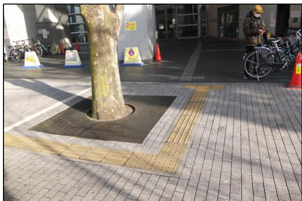
写真3：四谷区民センター前