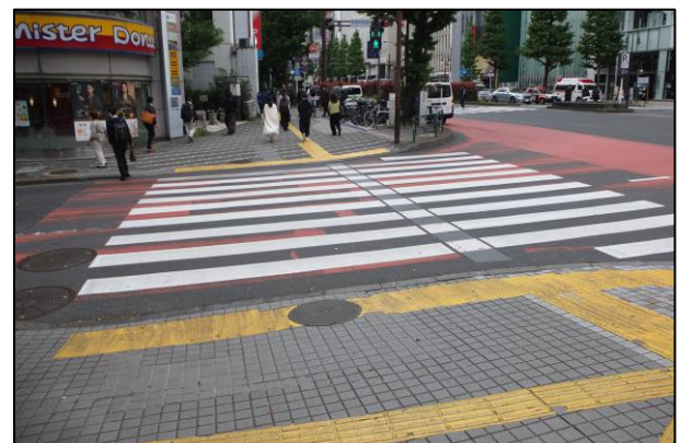
写真4：靖国通り横断歩道