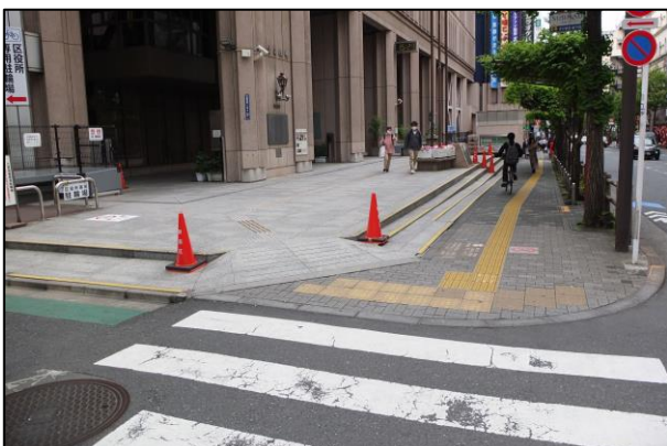
写真3：本庁舎入口のスロープ及び段差