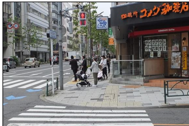
写真2：交差点部周辺の歩道