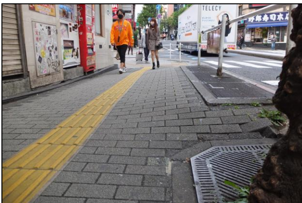
写真1：横断方向急勾配箇所