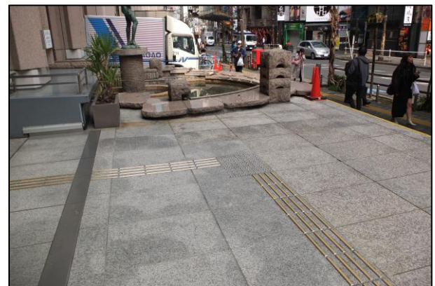
写真2：水景施設に近接した誘導ブロック