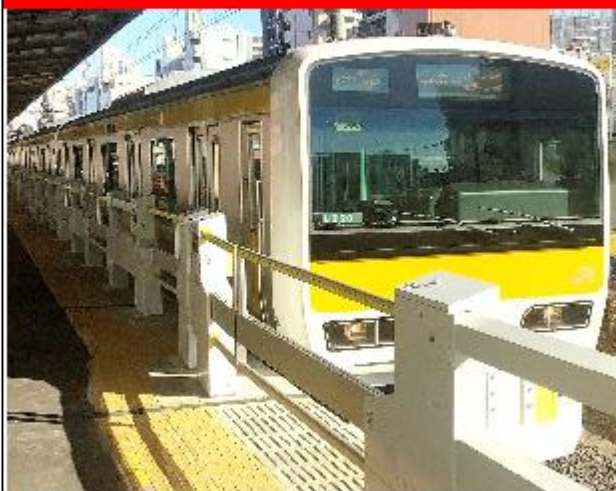
ホームドア(可動式ホーム柵)イメージ

御茶ノ水・千葉 方面 1番線ホーム 2022年5月13日(金) 新宿・三鷹 方面 2番線ホーム 2022年5月12日(木)