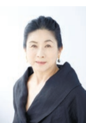
講師 真野響子(俳優)

●真野響子、漱石を声にする 夏目漱石の月命日である9日に、門下生たちが漱石をしのんで集まった九日会にちなむイベントです。 日時 3月9日(土)午後2時～4時 内容 漱石作品の朗読と講演 申込み 往復はがき(1人に付き1枚)に5面記入例のとおり記入し、2月6日(必着)までに問合せ先へ。定員70名。応募者多数の場合は抽選。 会場・問合せ 漱石山房記念館(〒162-0043早稲田南町7) ☎(3205)0209