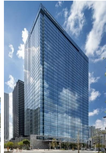
▲西新宿五丁目北地区防災街区整備事業で完成した公園・建物