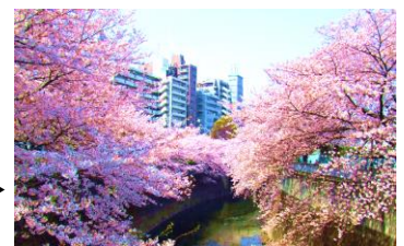
神田川沿いの ▶ 桜並木