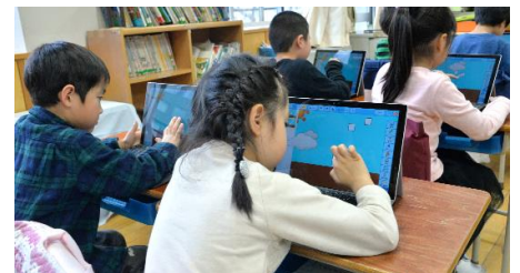
▲タブレット端末を活用した授業