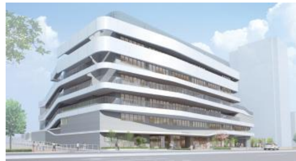
▲牛込保健センター等複合施設の建替えイメージ