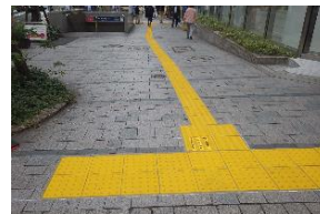
◀ 誘導用ブロックの連続設置