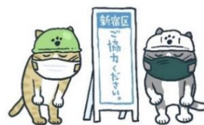
▲新型コロナウイルス 感染症予防のための啓発

・感染症に対する知識の普及啓発 ・定期予防接種や任意予防接種、健康診断の実施 など