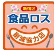
▲「食品ロス削減協力店」ステッカー