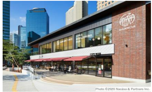
▲Park-PFIの活用事例 （新宿中央公園「SHUKNOVA」）