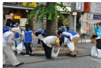
▲歌舞伎町清掃活動

・地域・警察・区が一体となったパトロール等の防犯活動の実施 ・路上喫煙禁止パトロールの実施 など