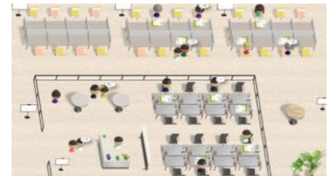
▲仮想空間（メタバース）