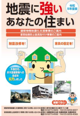
耐震促進パンフレット▲