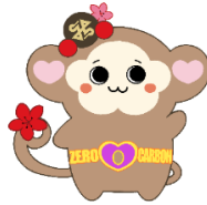
◀「ゼロカーボンシティ新宿」普及啓発キャラクター（もんぼん）

2050年までに区のCO 2 排出量実質ゼロを目指す「ゼロカーボンシティ」の実現に向けて、環境への負荷の低減に取り組んでいきます。