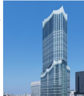
東急歌舞伎町タワー▶