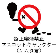
路上喫煙禁止 マスコットキャラクター (ケムタ君)