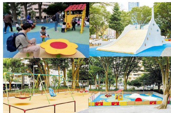
▲ リニューアル後のちびっこ広場 (新宿中央公園)