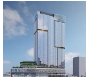
◀ 新宿西口地区開発計画完成予想図