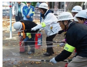
▲住民による防災訓練

・女性、高齢者、障害者など様々な視点を活かした避難所運営 ・災害用備蓄物資の計画的な更新・充実 など