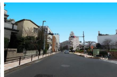
▲道路の無電柱化整備イメージ