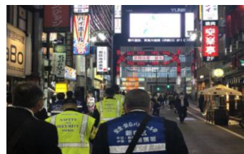
▲歌舞伎町のパトロール