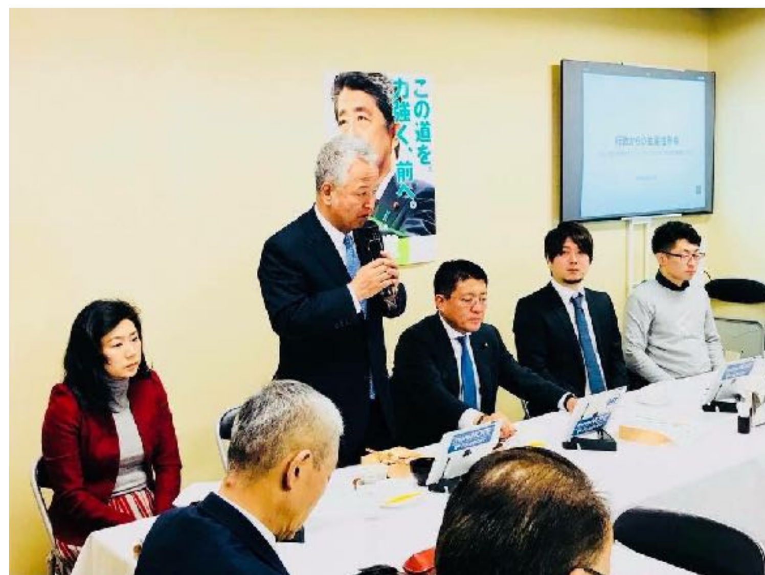
政府へのIT化戦略のご提言

日本の電子契約市場の立ち上がりを支え、 政府へのIT化戦略のご提言 を始めとし、 電子契約の普及とともに、事業を成長させてきました。