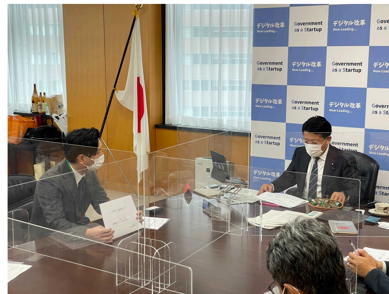
クラウド型電子署名サービス協議会の設立