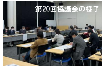
第20回協議会の様子