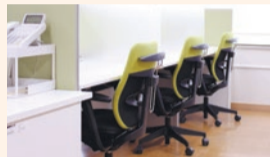
シェアオフィスの内観

対象 区内で創業を目指す方、創業して間もない方、経営改革を目指す個人または中小企業者