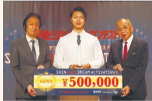
昨年度の表彰式の様子