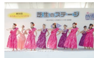
同フェスタ芝生のステージ

●4年ぶりに開催する同フェスタと一緒に盛り上げませんか 出演条件・必要書類等詳しくは、新宿区ホームページでご案内していません。事前にご確認ください。 出演日時 10月15日(日)午前10時30分～午後3時30分のうち15～20分程度 会場 都立戸山公園芝生広場(大久保3) 対象 区に活動拠点を置くアマチュア団体(合唱・吹奏楽・管弦楽・舞踊・演劇等)、10団体程度 申込み 任意の用紙に4面記入例のほか担当者名・団体名・出演者数・出演概要を記入し、必要書類を添えて、7月10日～31日(必着)に郵送で問合せ先へ。選考結果は8月10日(休)ころお知らせします。 問合せ 大新宿区まつり実行委員会事務局(〒104-0061中央区銀座7-13-21、銀座新六洲ビル6階(株)イベント・コミュニケーションズ東京営業所内) ☎080(7615)6256 区の担当課 文化観光課文化観光係(第1分庁舎6階) ☎(5273)4069