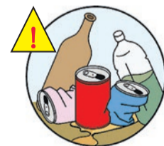
▲空き瓶・缶・ペットボトル