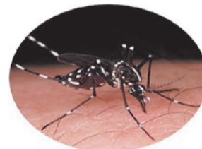
▲ヒトスジシマカ