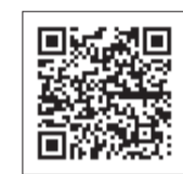
実施医療機関一覧