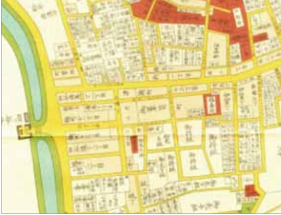
에도 죠 ( 성 ) 해자 주변도