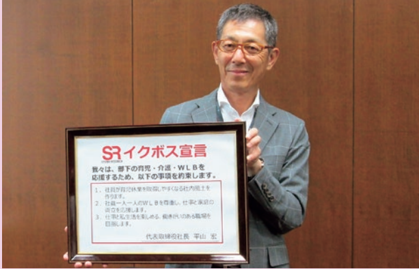
代表取締役による、イクボス宣言