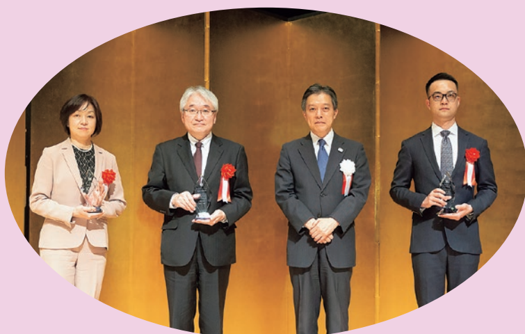
令和2年度受賞企業の皆様