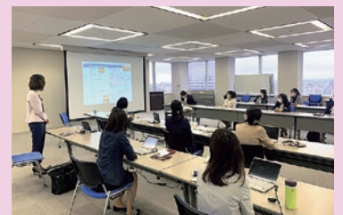
D&Iフォーラム ディスカッションの様子

社内ダイバーシティ&インクルージョンフォーラムでは、共働き社員の工夫事例やエンゲージメント調査をもとにした取組事例が共有されました。ライフイベントを迎えてもキャリアを築ける風土が醸成されていると感じます。経営層と直接話せる機会は貴重でした。ママ社員の提案から、制度改革に繋がった事例もあり、実務面でも働きやすくなっています。