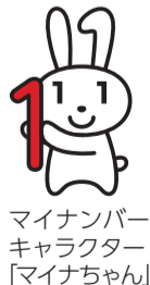
マイナンバーキャラクター「マイナちゃん」