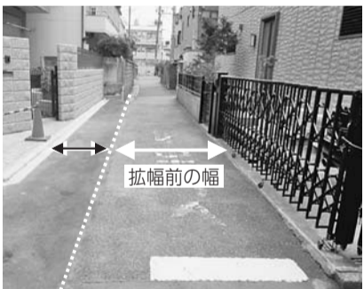
拡幅整備の例(←→は拡幅部分)

整備をしていない土地の所有者を区職員が訪問し、拡幅整備へのご協力をお願いしています。ご協力いただける場合、「道路の拡幅整備と維持管理」拡幅部分の固定資産税の非課税申告手続き代行」を区が行います。