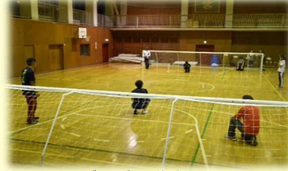
ゴールボール体験