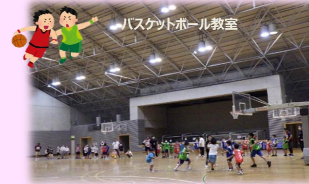
バスケットボール教室