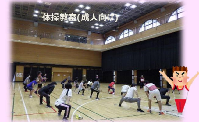
体操教室(成人向け)