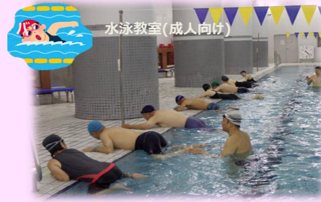
水泳教室(成人向け)