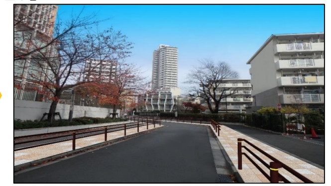
整備後のイメージ