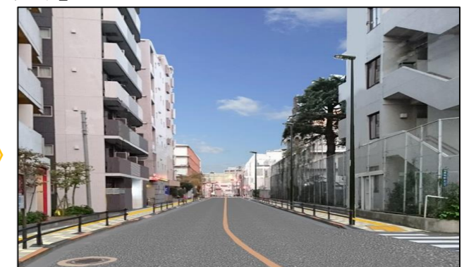
整備後のイメージ