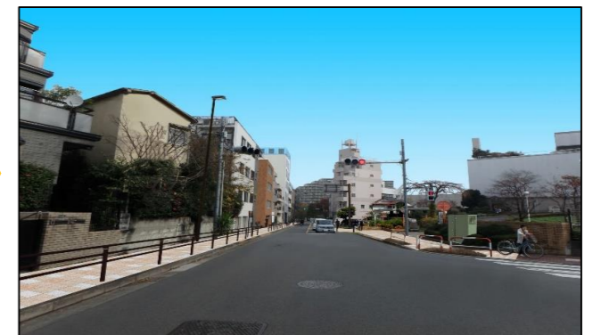
整備後のイメージ