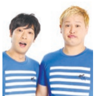
ゲスト ガリットチュウ