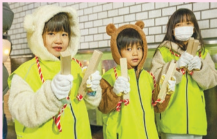
▶パトロールに参加した子どもたち

大久保二丁目町会では、従来の役員だけで行っていたパトロールを刷新し、幅広い年代の方に参加してもらうため、パトロールグッズを新たに購入したり、参加賞を配るなど、参加して楽しいイベントとして実施しました。