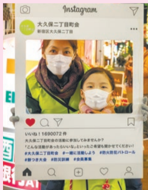
▶記念撮影用のSNS/パネルで楽しむ親子