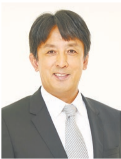
講師 星野伸之(元プロ野球選手)

申込み 電話かほかぎ・ファックス(5面記入例のほか年齢・学年・電子メールアドレス(お持ちの方)・質問事項への回答(質問▶①1日の平均運動時間は60分以上か、▶②①がいえの方は運動に取り組みない要因、▶③スポーツの得意・不得意)を記入)で3月3日(金)午後6時(必着)までに問合せ先へ。問合せ先ホームページ( https://wakuwakuports.yoshimoto.co.jp )からも申し込めます。応募者多数の場合は抽選し、3月6日(月)以降に結果を郵送・電子メールでお知らせします。定員に空きがある場合は、3月7日(火)から電話かファックスで受け付けます(先着順)。イベント当日は当選者と保護者以外は入場できません。