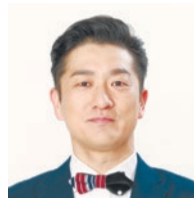
司会 キクチウツカナイ。

日時 3月21日(祝)午後1時～2時45分 会場 新宿ここ・から広場(新宿7-3-29) 雨天時:新宿スポーツセンター(大久保3-5-1) 対象 小学生、60名