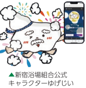
▲新宿浴場組合公式キャラクターゆげじい

問い合わせは各銭湯でも受け付けています。 ★…NFT(エヌエフティー)とは、「固有の価値を持つ偽造できないデジタルデータ」のことをいいます。 期間 3月5日(日)まで 対象 中学生以上 後援 新宿区 会場・主催 区内銭湯18か所 問合せ 地域コミュニティ課管理係(本庁舎1階) ☎(5273)3519