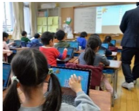
パソコンを使った授業