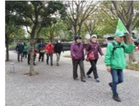
ウォーキングイベント