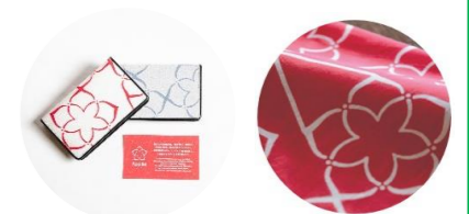
Azaléeプロジェクトで企画、開発した 名刺入れ(左)、手拭い(右)