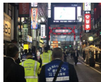
歌舞伎町のパトロール