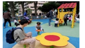
リニューアルした新宿中央公園 ちびっこ広場