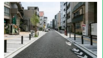
バリアフリー化した道路