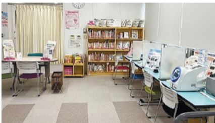
▲同センターの様子