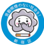
▲受動喫煙防止対策推進マスコット「けむいモン」

区内事業者が公衆喫煙所・喫煙専用室等を整備する際に、設置・改修の費用を助成します。助成総額に達し次第受け付けを終了します。申し込み方法・要件等詳しくは、お問い合わせください。新宿区ホームページでもご案内しています。