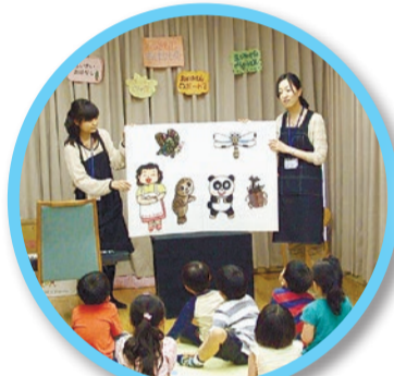
よみかかせ会の様子