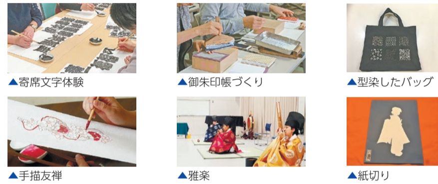
▲寄席文字体験 ▲御朱印帳づくり ▲型染したバッグ ▲手描友禅 ▲雅楽 ▲紙切り

対象 16歳以上の方 費用 各プログラム1回につき100円(保険料等) 申込み はがき・ファックスに5面記入例のほかプログラム名(①～⑥の別)・③以外 は希望日時を記入し、10月21日(必着)までに問合せ先へ。応募者多数の場合は、 区内在住の方を優先して抽選。 問合せ 文化観光課文化観光係(〒160-8484歌舞伎町1—5—1、第1分庁舎6階) ☎(5273)4069・☎(3209)1500