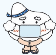
▲新宿浴場組合公式キャラクターゆげじい