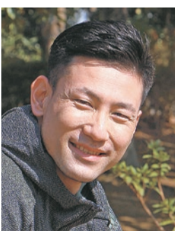
講師 塚原直貴 (北京オリンピック4×100mリレー銀メダリスト)

申込み 電話かほかき・ファックス(3面記入例のほか、年齢、学年、電子メール(お持ちの方)、質問事項への回答(質問①1日の平均運動時間は60分以上ですか。質問②①がいいえの方は運動に取り組めない要因(例:忙しい、近くにスポーツできる場所がない等)。質問③スポーツは得意か不得意か)を記入)で、9月2日(金)午後6時(必着)までに問合せ先へ。同イベントホームページ(下二次元コード。HP https://wakuwakusports.yoshimoto.co.jp )からも申し込みます。応募者多数の場合は抽選し、9月5日(月)以降に結果を郵送・電子メールで全員にお知らせします。定員に空きがある場合は、9月6日(火)から電話かファックスで受け付けます(先着順)。イベント当日は当選者と保護者以外は入場できません。