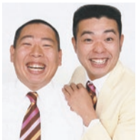
ゲスト レギュラー