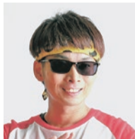
ゲスト バイク川崎バイク