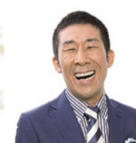
ゲスト 田村裕(麒麟)