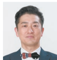
司会 キチウツツカナイ