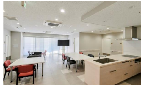
グループホーム静華庵共有スペース