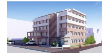
施設の外観 (予想図)