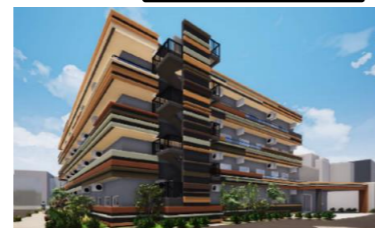
施設の外観 (予想図)