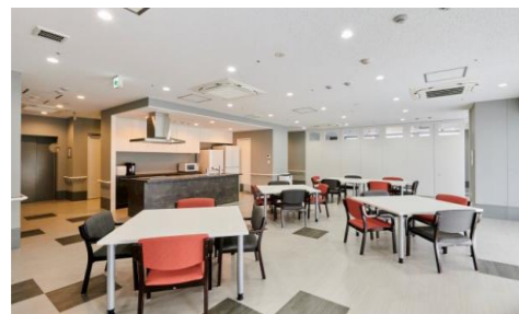
小規模多機能ホーム静華庵3階デイフロア