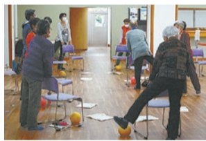
▲からだ元気体操の様子

【日時】4月11日・18日・25日、5月9日・16日・23日、6月6日・13日・20日、7月4日(5月2日・30日、6月27日は自主活動日)の月曜日午前9時30分~11時30分