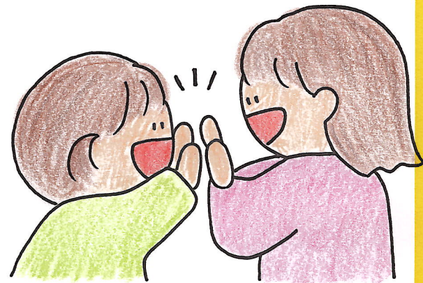
自分のひざや おうちの人と3回とんとん