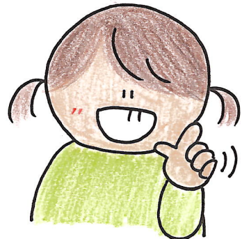
親指と人差し指を立てて 「ちっち」と3回振る