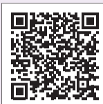
ワクチン 接種情報

【問合せ】区新型コロナウイルスワクチン接種コールセンター ☎03(4333)8907・☎0570(012)440(ナビダイヤル)へ。