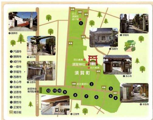
須賀町町会パンフレット(須賀町町会・新宿区)より