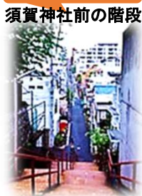
須賀神社前の階段