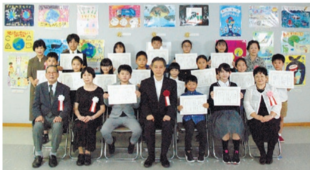
▶今年度受賞者の皆さん

今年度のごみ減量絵画の応募者は、小学校低学年の部が179名、小学校高学年の部が121名、中学生の部が19名でした。