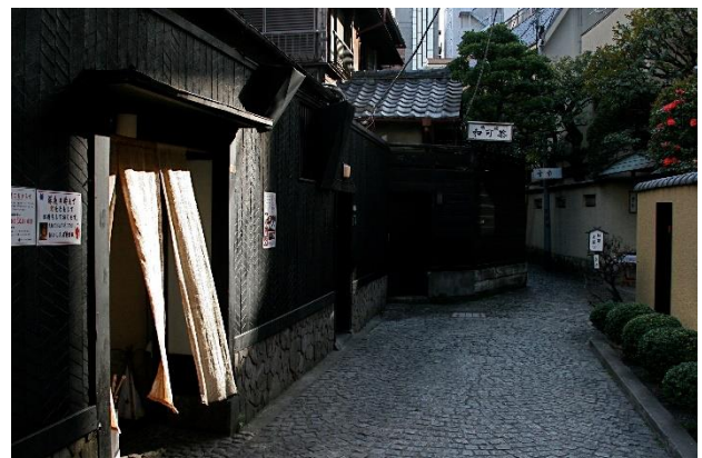
日本らしい景観(神楽坂)