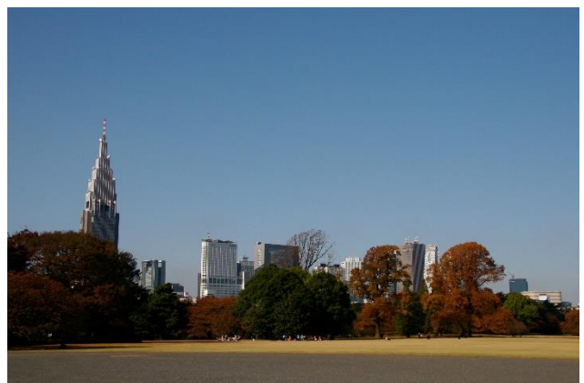
新宿御苑からの眺望景観