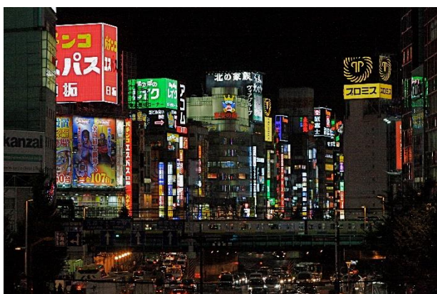
賑わいを創出する夜間景観(歌舞伎町)