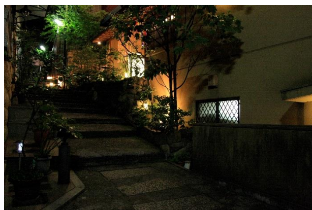
落ち着いた雰囲気(神楽坂)