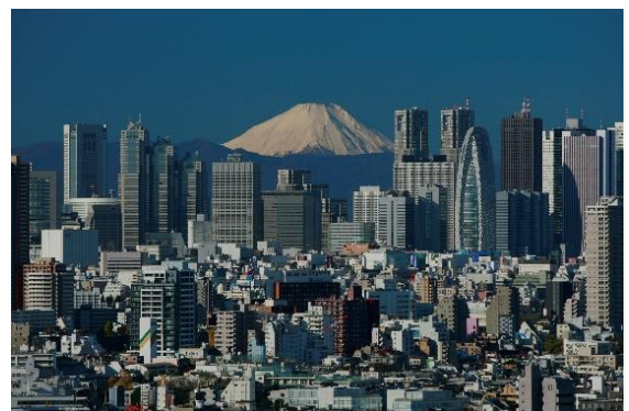
西新宿ビル群が形成するスカイライン