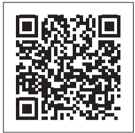
▲東京オリンピック・パラリンピック競技大会組織委員会ホームページ