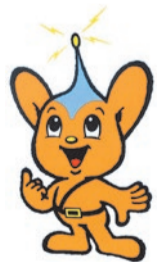
▲ピーポくん・警視庁マスコットキャラクター

◆発表 11月下旬ころに入賞者にお知らせするほか、警視庁ホームページでもお知らせします。