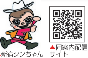
▲新宿シンちゃん ▲同案内配信サイト