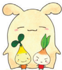
▲協働推進基金マスコットキャラクター

【問合せ】地域コミュニティ課管理係(〒160-8484歌舞伎町1-4-1、本庁舎1階) ☎(5273)3872へ。