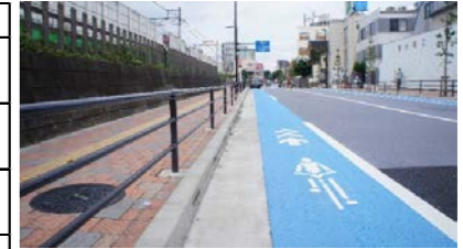
【整備例】津の守坂通り