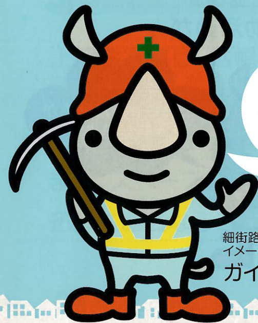
細街路拡幅整備事業 イメージキャラクター ガイロ君