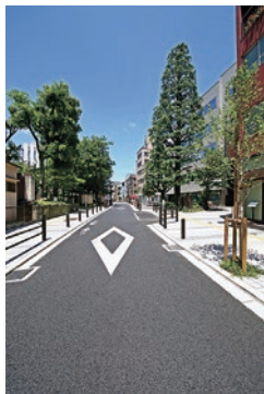
▲無電柱化イメージ

無電柱化推進計画に基づき、電線類を地下に埋設し、電柱を撤去することにより、災害に強いまちづくりを進めるとともに、歩行空間のバリアフリー化や美しい都市景観の創出を図ります。また、民間大規模開発等の機会を捉え、事業者は無電柱化の整備を要請していきます。