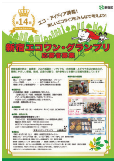
▲同グランプリ募集チラシ(環境対策課・環境学習情報センターで配布)