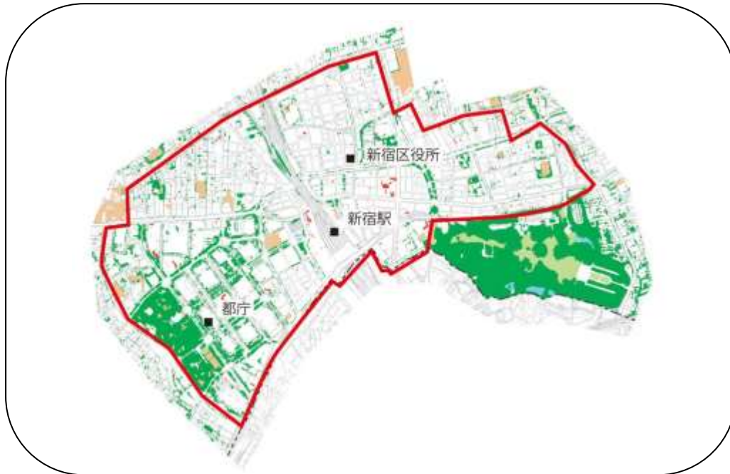
屋上緑化等推進モデル地区指定区域

モデル地区では、緑化計画書制度、屋上等緑化助成制度を活用し、また新宿花いっぱい運動を推進し、屋上緑化と壁面緑化、草花緑化をすすめていきます。