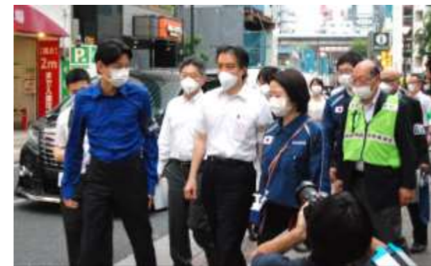
【区、事業者、都がチームを組み店舗へ向かう様子】

7月20日（月）・21日（火）に、区と繁華街の事業者、東京都が連携し、警察の協力を得て、歌舞伎町地区のホストクラブ、キャバクラなど接待を伴う店舗（2日間で約300店舗）を戸別訪問し、チェックリストや啓発チラシなどを配布することで、感染拡大防止の徹底について協力を依頼しました。