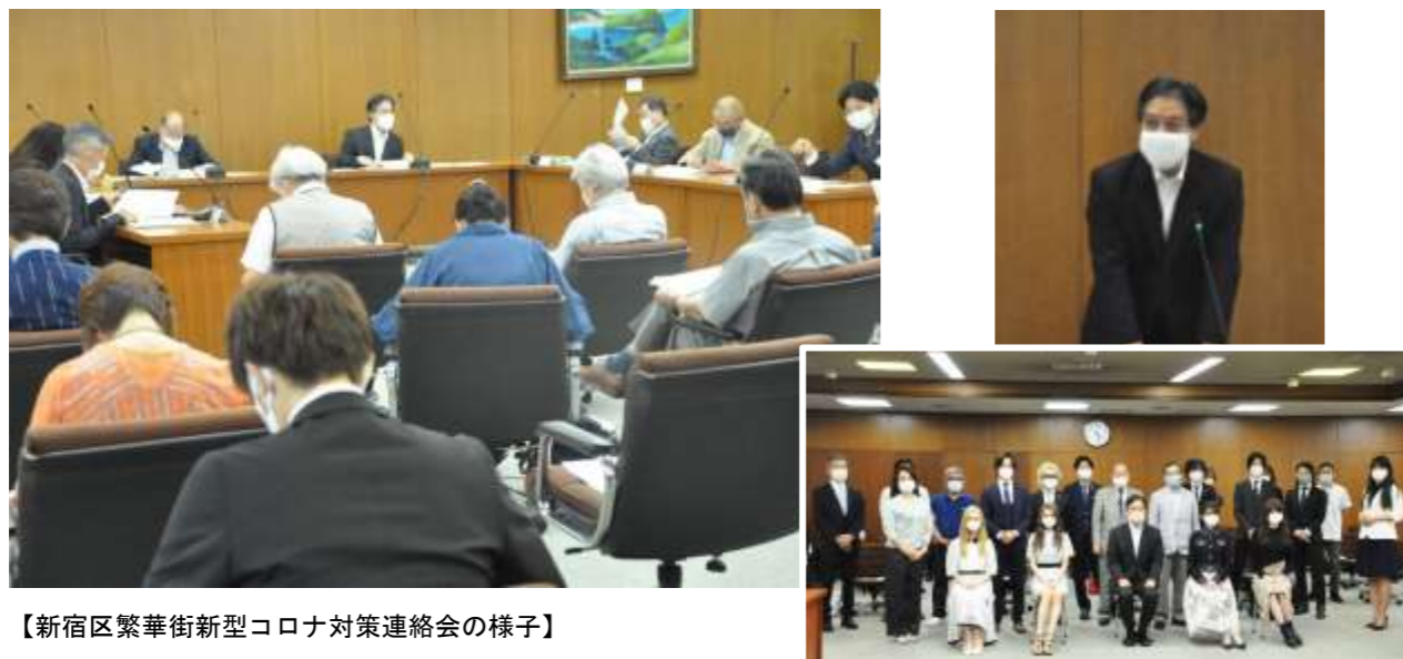
【新宿区繁華街新型コロナ対策連絡会の様子】

また、区と多様な店舗経営者等による新型コロナウイルスに関する勉強会も継続的に開催しています。（6～8月で9回開催）