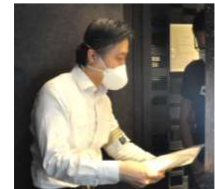
【啓発チラシを説明する様子】