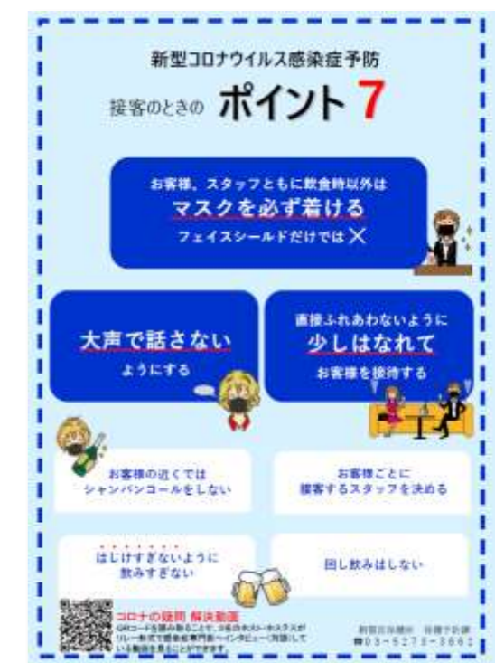
【接客のときの注意事項を記載した啓発チラシ】