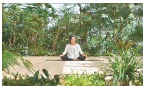
PARKERS TOKYO (イメージ)