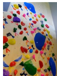
▲PARKERS TOKYO内 ボルダリングスペース