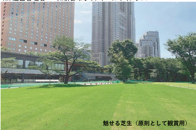
魅せる芝生 (原則として観賞用)