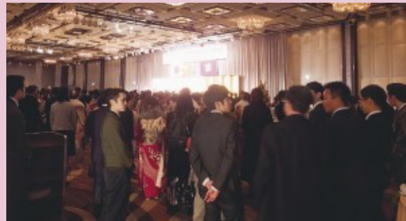
式典会場は大盛況