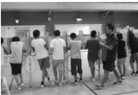
投票（落合第三小学校）