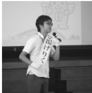
演説（余丁町小学校）