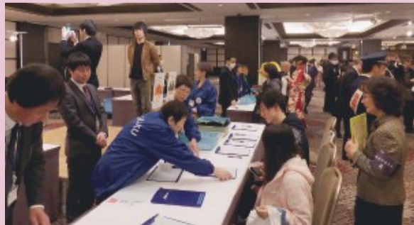
立会人受付の様子

毎年恒例の「選挙啓発ブース」では、「選挙に関するアンケート」や「投票立会人」申込みの受付、「選挙啓発用ポスターモデル」の写真撮影などを実施しました。新成人の皆様、お立ち寄りいただきありがとうございました。