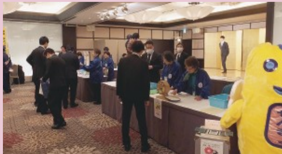
アンケートや写真撮影も実施