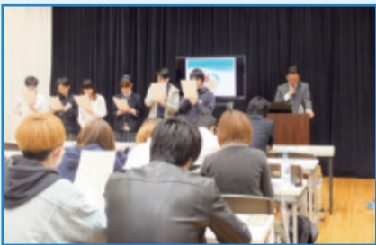
4月7日 東放学園高等専修学校

新宿区選挙管理委員会では将来の有権者へ向けて、選挙に対する関心を高めてもらえるような授業を展開しています。平成29年度は、区内15校の小学校、5校の高等学校等で出前授業を実施。選挙に関する知識を深める講義や、実際の選挙で使用している機材を使った本格的な模擬投票体験を行いました。