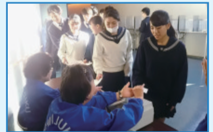
1月24日 目白研心学園高等学校