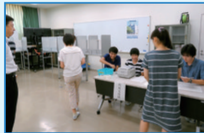
7月10日 戸山高等学校