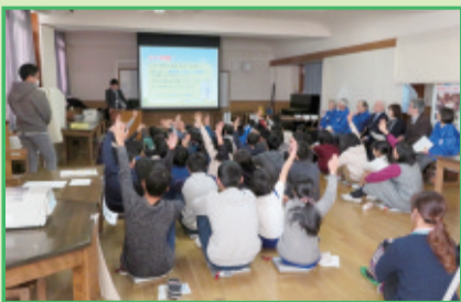
1月27日 淀橋第四小学校