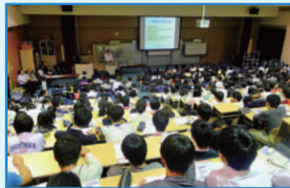
5月17日 新宿高等学校