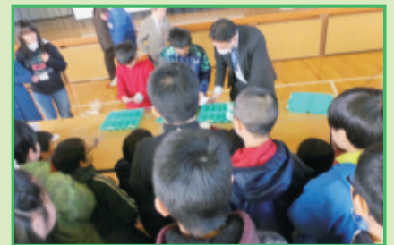
2月9日 戸塚第二小学校