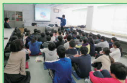
2月17日 落合第二小学校