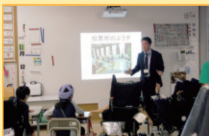
10月2日 新宿養護学校