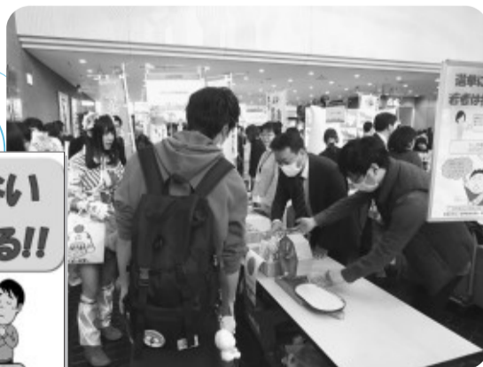
配布した若年層向け啓発チラシ

平成29年12月9日(土)に若者のつどいが行われました。行政情報ブースにて選挙啓発を実施しました。選挙啓発グッズや、新宿区選挙管理委員会作成の若者向けチラシを配布しました。多くの来場者にお立ち寄りいただきました。