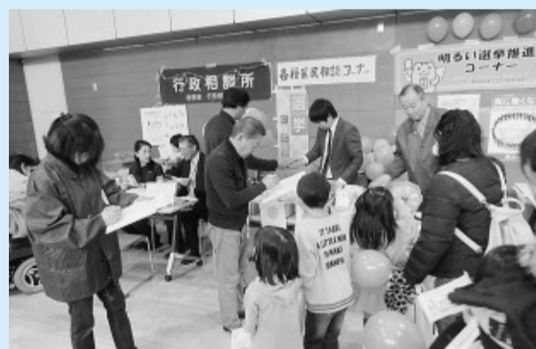
12月3日 角筈わいわい広場(角筈地区) 選挙にまつわるクイズを出題

かしわまつりでは、「むかーし昔ばなし選挙」と題し、日本古来の昔話のテーマを6つ選定し、人気投票を行いました。実際の選挙で使用している投票箱や記載台を使用した模擬投票で、初めて見る投票箱に子どもたちは興味津々。親子で投票を楽しむ姿もありました。総投票数は280票。つるの恩返しが78票を獲得し、一番人気となりました。