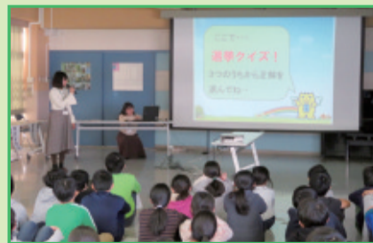
2月8日 牛込仲之小学校