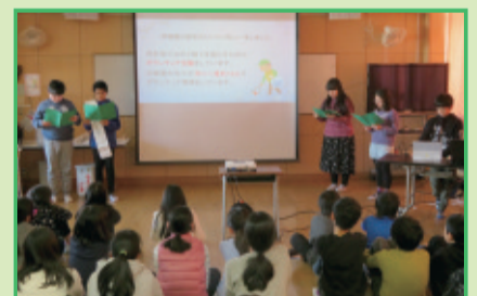
1月26日 西新宿小学校