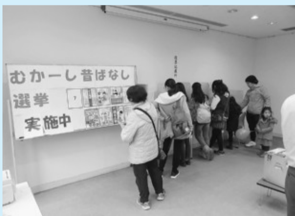
11月19日 かしわまつり(柏木地区)