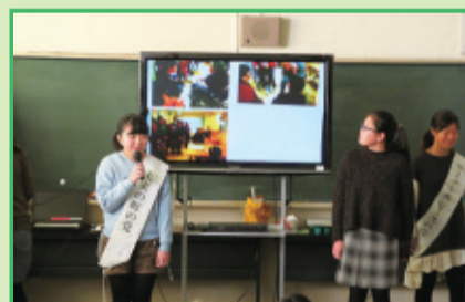
1月20日 戸塚第三小学校