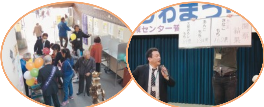
かしわまつり「おもち選挙」の様子

今号の紙面では、26年7月以降に行われた6つの地域まつり等での啓発をご紹介します。その中で、今回新たな取り組みとして11月16日に行われたかしわまつりで「おもち選挙」を行いました。「おもち選挙」では、かしわまつりで出品されている3種類のおもちを候補者に見立て投票をしてもらいました。実際の選挙の機材を使用したので、特にお子さんにとって貴重な体験となったのではないのでしょうか。