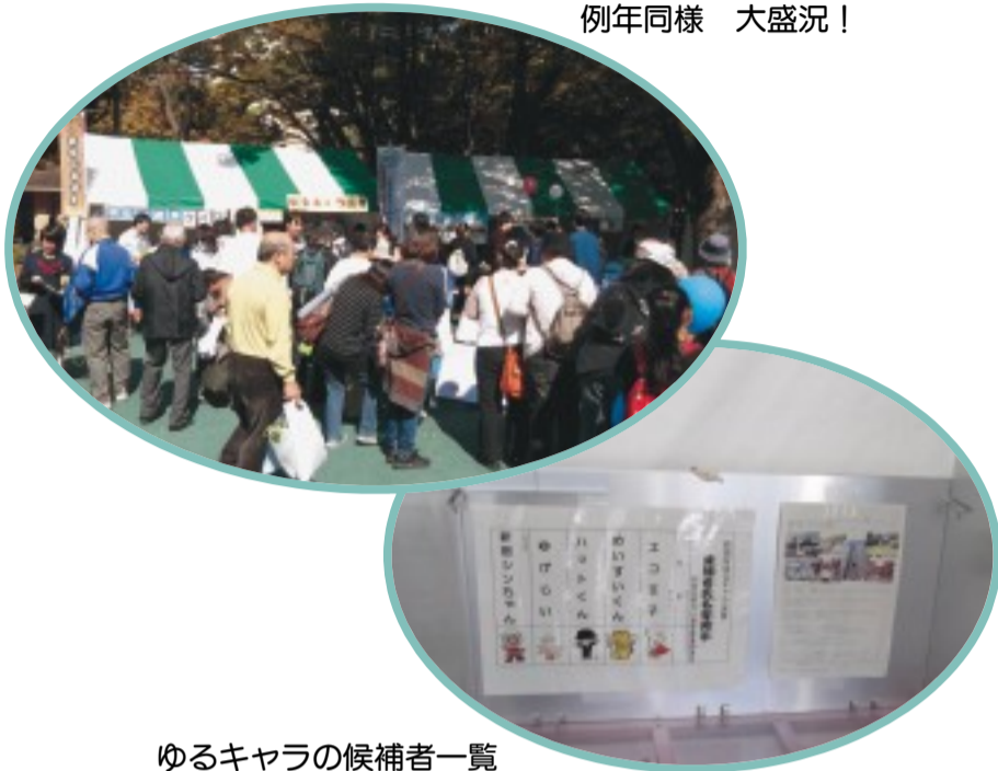
ゆるキャラの候補者一覧