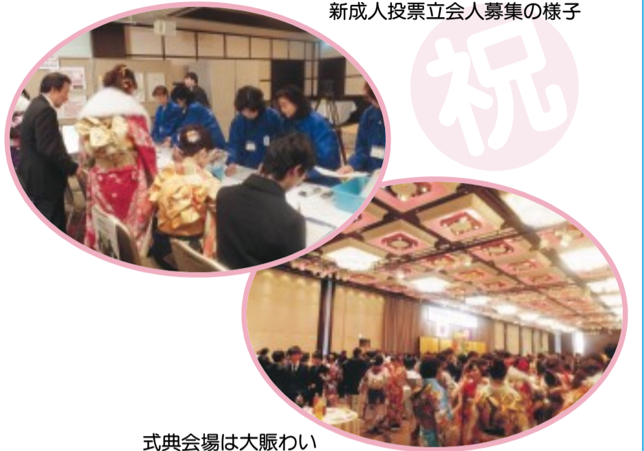
式典会場は大賑わい