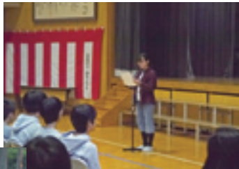
▲3月16日(木)、表彰式で天童での思い出を発表する児童