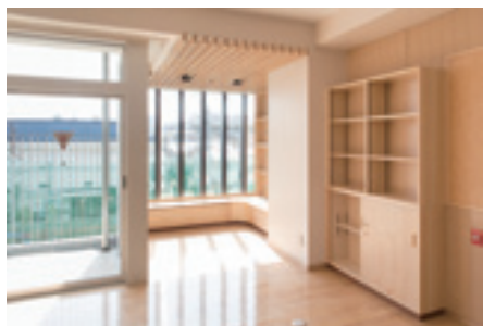
▲ベランダと一体に使える普通教室内のフリースペース