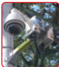
▲通学路防犯カメラ