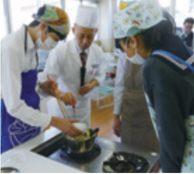
▲講師から味噌汁作りのアドバイスをもらう生徒たち

はじめに、食のあり方や「いただきます」の言葉に込められた意味、また日本料理の核となる出汁の話などをご講義いただきました。講師の