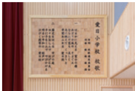
▲旧校庭にあったヒマラヤ杉を子どもたちが彫って製作した校歌板