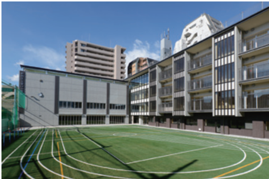
▲周辺と調和した色調を使い、壁面に凹凸を加えたり、素材を切り替えたりすることで、大きな面を感じさせない工夫を施した新校舎の外観