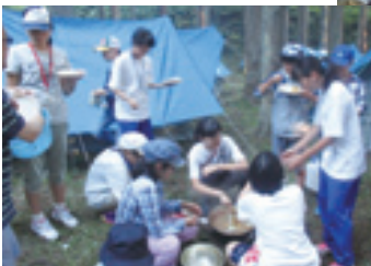
▲天童でのキャンプのようす