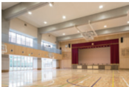
▲校庭側にスライド扉を設け、校庭と一体的に使えるようにしたアリーナ