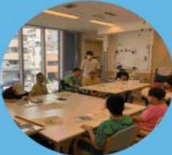
@社会福祉法人 南風会 シャロームみなみ風

生活介護事業所の日中活動支援を行っています。事業所の利用者が個々の能力を生かし、作業方法を工夫することでクオリティーの高い商品を作り、販売利益を作業代として利用者に還元しています。就労と言う概念を持ちづらい重症心身障害者であっても、社会人としての役割と自覚を持つことで、生きる喜びへ繋げていくことを目的に活動しています。