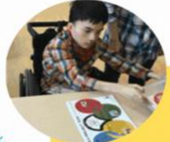
@社会福祉法人東京コロニー コロニー中野