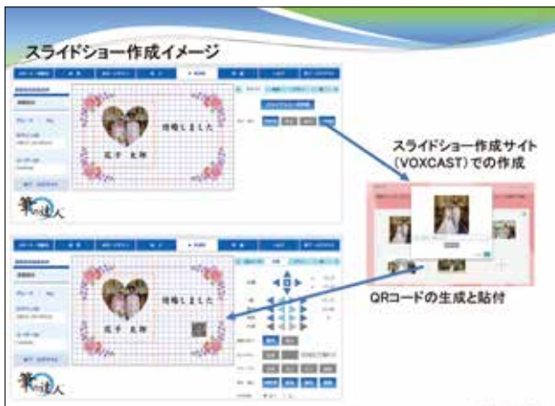
スライドショー等を読み取れるQRコードを貼付けて、感動的なメッセージカードをつくることできる

「これを機にB to BのビジネスモデルをB to B to Cに進化させ、パッケージ・ソフトウェア・メーカーからアプリケーション・サービス・コンテンツプロバイダーへのイノベーションを考えています」