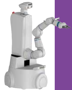
研究室や工場、室内農園などで活躍する移動マニピュレータ「Torobo MMJ」

加速度的に支援するプラットフォームロボットとして高く評価されました。前者は平成28(2016)年度日本機械学会優秀製品賞、平成30(2018)年度日本ロボット学会実用化技術賞を受賞しています。