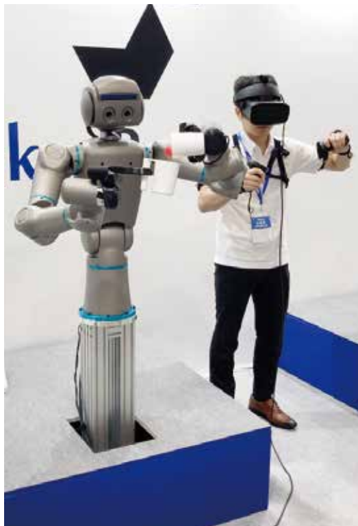
遠隔操作のデモンストレーション。ロボットと人が同じ動きをする

「ベンチャーにおけるロボット開発の魅力は川上から川下まで、企画、設計、組み立て、販売までの全てを経験できること。私の専門は画像処理技術ですが、それぞれの専門家が集まることで、人ができることをロボットでできるようにするという遠大な目標も現実味を帯びる。これからの遠大な目標も恐れず挑戦を続けていきたいと思えます」