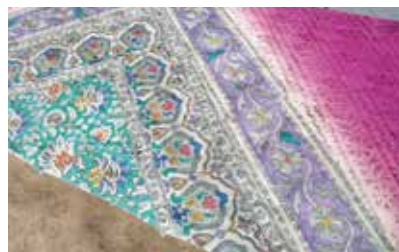
このような「ぼかし染め」も得意とする

新宿区染色協議会のイベントでは、来場者に引染の技術を公開するなど、染の普及に積極的にあたっている。