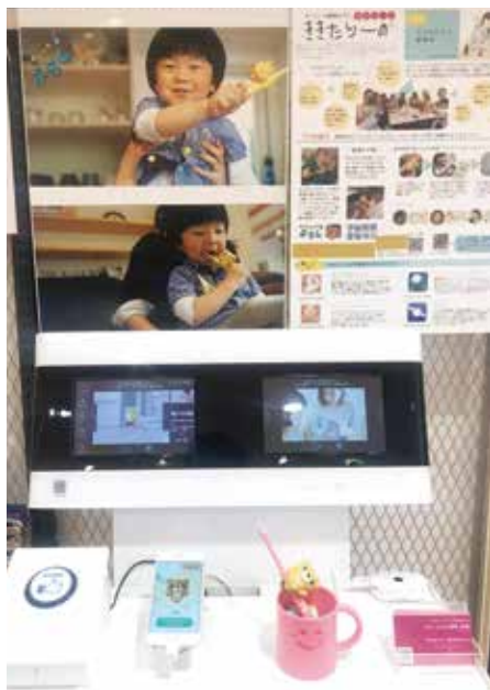
ソフトバンク銀座店で行われた「シャカシャカぶらしキット」の商品展示

「アプリに従って歯磨きをする、歯磨き完了後に褒めスタンプがもらえる仕組みなので、歯磨きの質を向上させ、歯磨きを習慣化させる動機付けができます。私自身も起業後に母親になったため、育児における歯磨きの大切さを痛感しています」