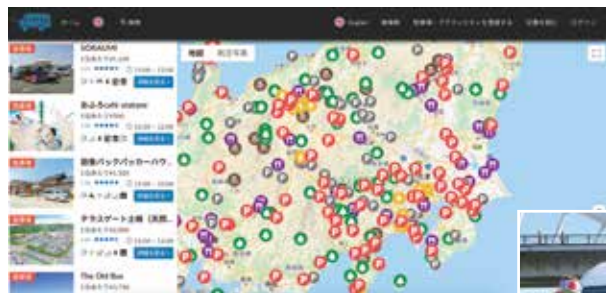
上)全国の「車中泊」・「テント泊」ができるスポットを検索できる 右)ラグビーワールドカップ開催時には、海外選手もCarstayのサービスを利用