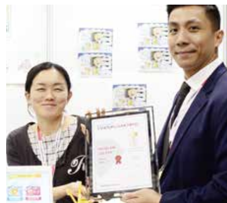
スタートアップを応援する海外の賞で優勝(課題解決部門)

資金調達や製造のノウハウ獲得に苦労したものの、公的な起業支援制度や区の補助金制度、起業準備段階から培ったエンジニアやキャラクター・デザイナーなどの専門家ネットワークなどを有効活用し、国内や中国の工場へ自ら足を運んで試作品を完成させました。そのユニークな発想とIoTによるものづくりのアイデアは高く評価され、東京都女性ベンチャー成長促進事業プログラムなどに採用されたほか、NHKの「まちかど情報室」など各種メディア