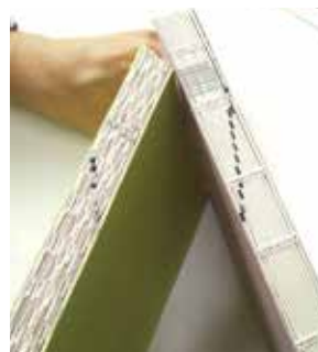
あじろ綴じ(左)とスレッドシーリング(右)

東京製本高等技術専門学校では「デザイン概論」の講座を担当し、後進の指導にあたる。技術・技能一辺倒ではなく、コストも併せて顧客の満足度につなげることを指導し、製本の価値を科学的に分析することで本の魅力を創り出していくことを目指している。