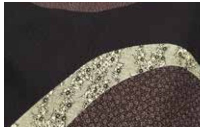
数種の小紋を組み合わせた作品

現在、自社工場では3名の育成・指導にあたり、東京都染色協同組合および新宿区染色協議会では若手会員への指導も行っている。