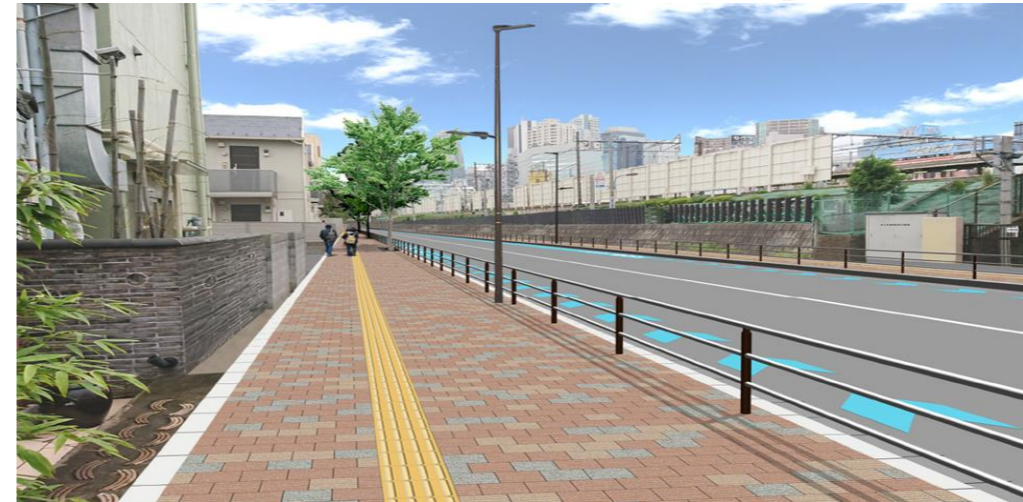
※自転車ナビライン