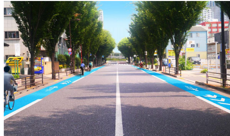
※自転車専用通行帯

区では、歩行者、自転車、自動車それぞれが安全に安心して通行できる自転車通行空間(自転車専用通行帯、自転車ナビライン・ナビマーク等から道路幅員等の現地状況を踏まえ選択)を整備しています。この度の全線開通に合わせ、令和2年度に補助第72号線全線(新宿区部分)に自転車通行空間を整備します。