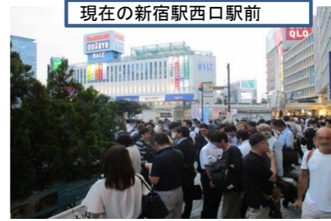
現在の新宿駅西口駅前

喫煙所と歩道との境界がわからないほど混雑する、現在の新宿駅西口駅前喫煙所(植栽の中が喫煙所。下の写真の赤枠。青枠は第二喫煙所)