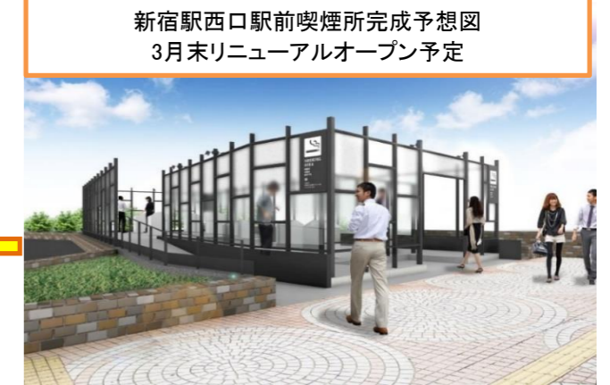
新宿駅西口駅前喫煙所完成予想図 3月末リニューアルオープン予定

喫煙所と歩道との境界がわからないほど混雑する、現在の新宿駅西口駅前喫煙所(植栽の中が喫煙所。下の写真の赤枠。青枠は第二喫煙所)